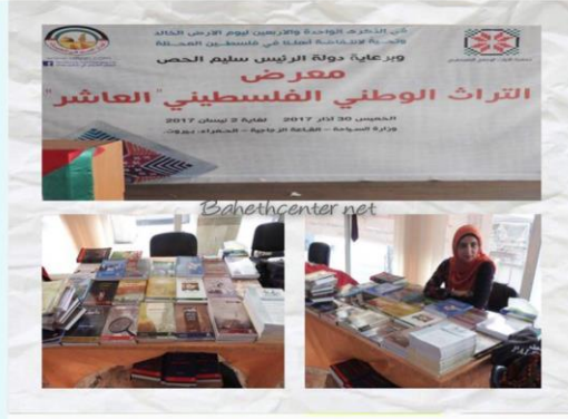
معرض التراث الوطني الفلسطيني العاشر في بيروت من 30 آذار لغاية 2 نيسان 2017 .