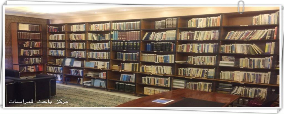
مركز باحث للدراسات