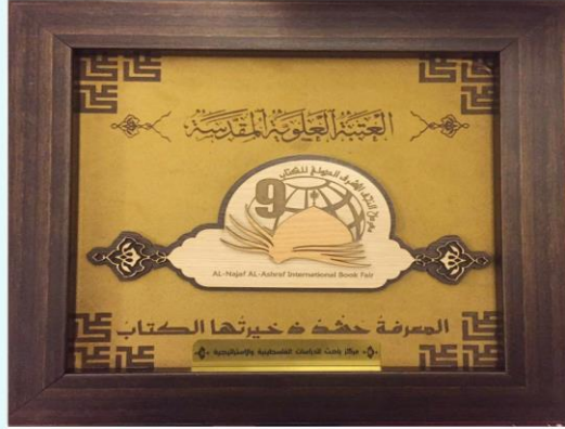
درع تكريم لمركز باحث للدراسات من أمين عام العتبة العلوية المقدسة السيد نزار هاشم